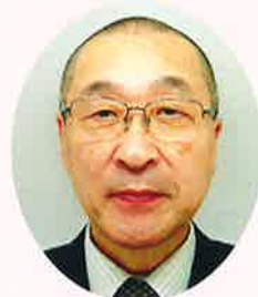
日光市文化協会日光支部長