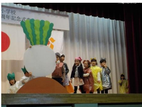
創立 150 周年記念日小フェスティバル