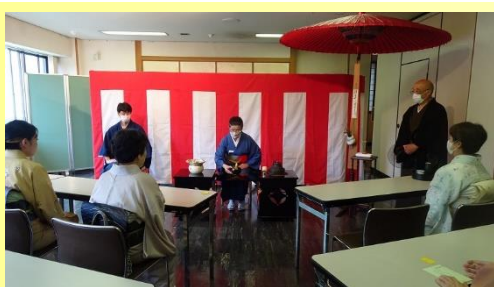
日光山輪王寺紫雲閣1階(裏千家)

市内で活動する三団体からなる日光敬会が中心となり、日光山輪王寺本坊表書院に表千家、日光山輪王寺紫雲閣一階に裏千家、二階に大日本茶道学会がそれぞれ席を設けてお客様をおもてなしました。県内外からお越しのお客様