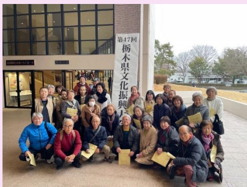
日光市文化協会の集合写真

鼓保存会による腹にしみる和太鼓や、芳賀町民舞会の舞踊があり、最後にもてぎヒップホップ教室の子ども