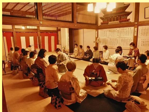
日光山輪王寺本坊表書院(表千家)