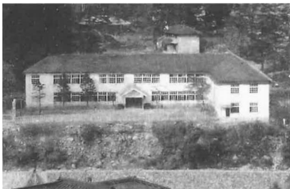
明治31年(1899) 建立の二つ目の校舎