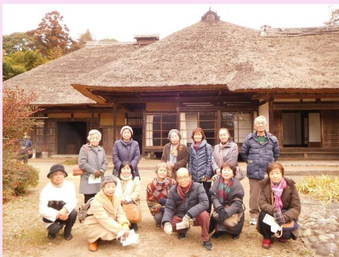
入野家住宅前にて

見学先 入野家住宅 (市貝町) 会場 KBELO(真岡いちご)ホール (真岡市民会館)