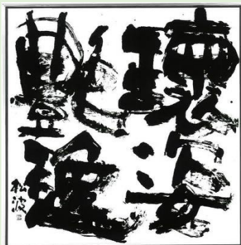
石戸絹江(松波) 第74回毎日書道展 秀作賞「環姿艶逸」(100×100)