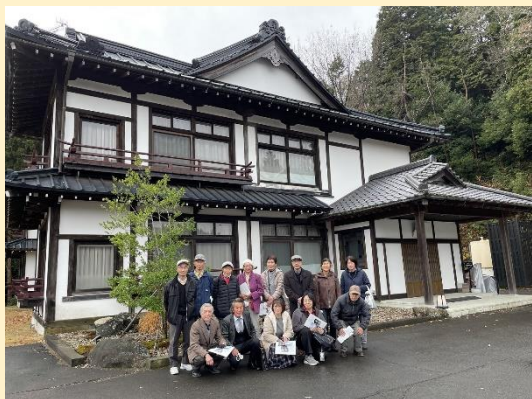
泉 南間ホテル」とみえる。

やや穿 うが つた南間ホテル宣伝に「バード女史ゆかりの旅館 政府登録国際観光旅館 日光国立公園湯元温