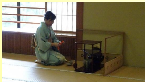
日光山輪王寺紫雲閣2階(大日本茶道学会)